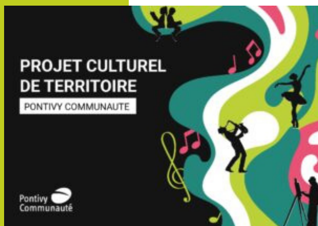
Schéma de développement culturel de Pontivy Communauté- Contribution du conseil de développement du Pays de Pontivy

Une fois le projet finalisé, malgré un calendrier serré, 10 membres du conseil se sont réunis pour formuler un avis sur le projet culturel proposé par les élus.